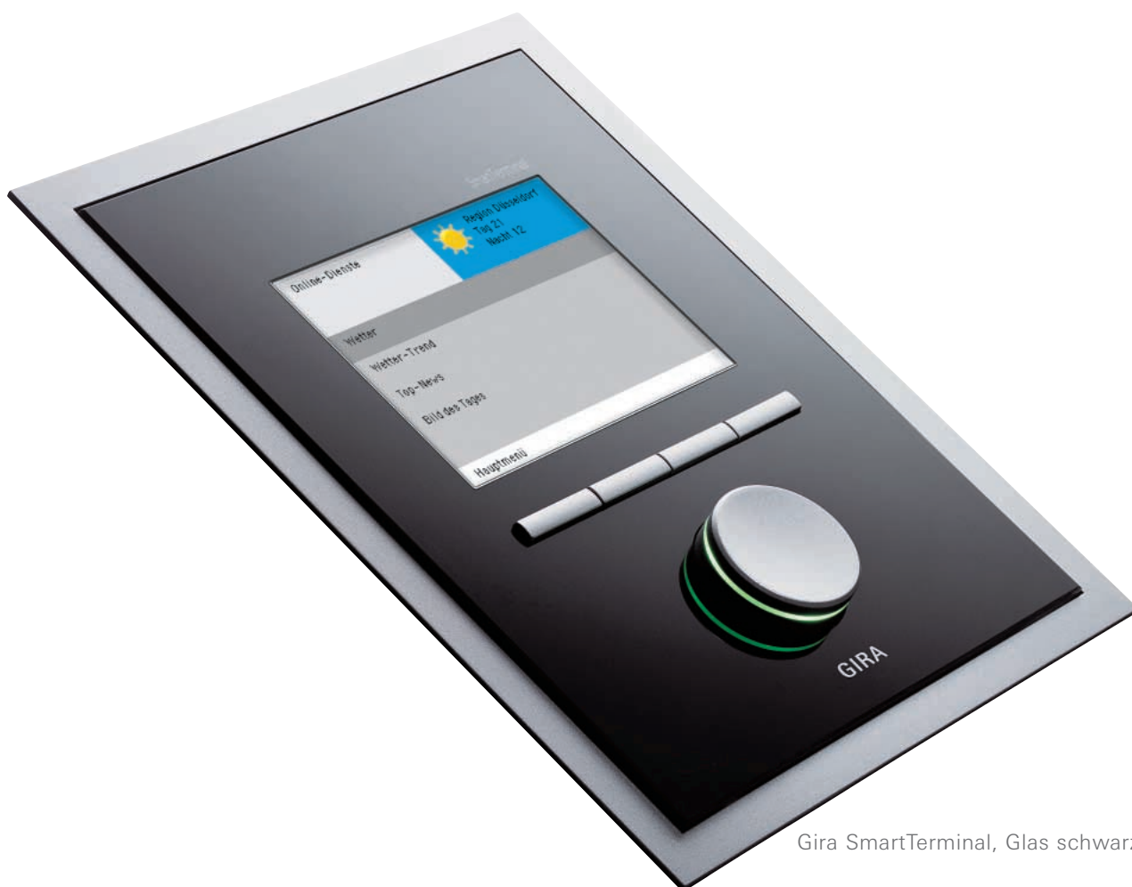
Gira SmartTerminal, Glas schwarz

Die Chancen im Bereich der komplexen Gebäudesystemtechnik, um Kunden zu begeistern und zu gewinnen, können durch die effektive und durchweg effiziente Zusammenarbeit mit den System-Integratoren realisiert werden.