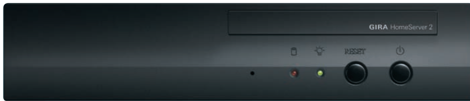
Gira HomeServer 2